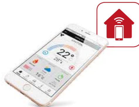
REMOTE MANAGEMENT SYSTEM