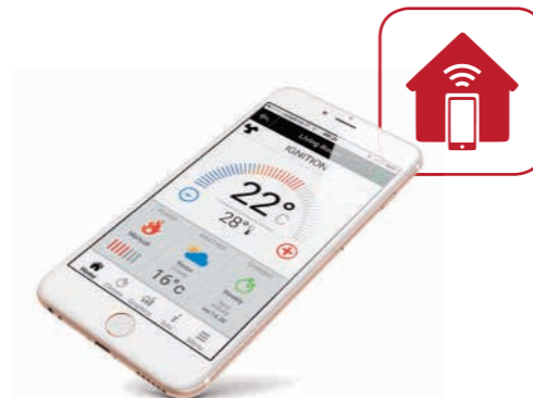
REMOTE MANAGEMENT SYSTEM